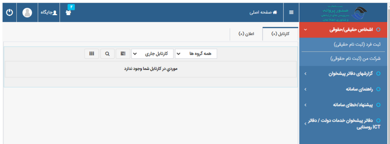
شکل ۱-۱ منو/کارتابل متقاضی

بعد از ورود به سامانه در صفحه‌ی اول، کارتابل متقاضی قابل مشاهده می باشد. طبق شکل ۱-۱ کاربر متقاضی از طریق منوهای سمت راست می تواند اطلاعات خود را تکمیل و سپس درخواست خود را ثبت نماید.